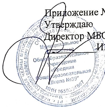
График работы родительского контроля за организацией питания детей в МБОУ «Средняя общеобразовательная школа №39»